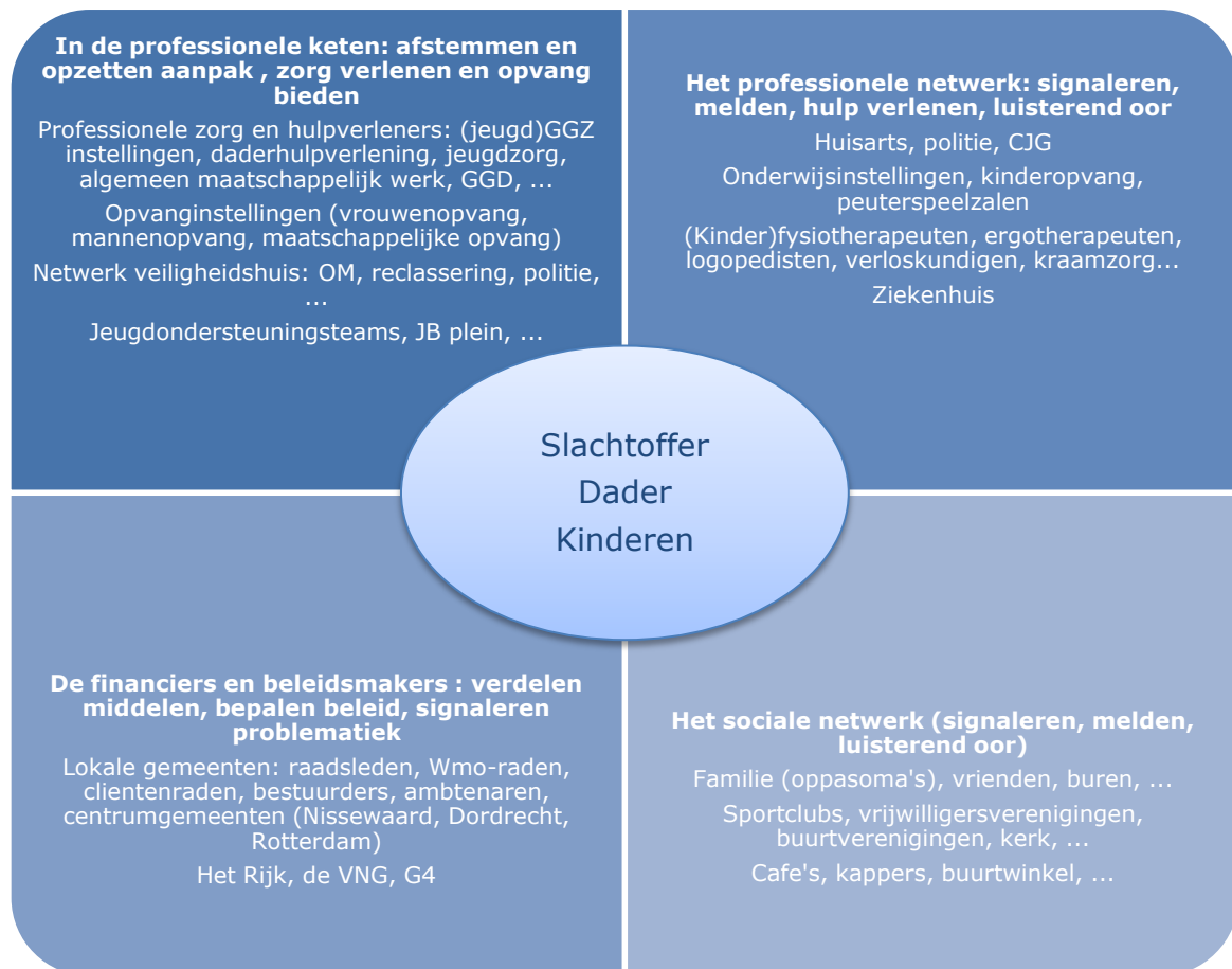
Figuur 1: stakeholders huiselijk geweld en kindermishandeling

Er zijn veel partijen (stakeholders) betrokken in de aanpak van huiselijk geweld en kindermishandeling: van het slachtoffer, de dader en de betrokken kinderen, tot het sociaal netwerk en het professionele netwerk (ketens). Van het buurtcafé op de hoek waar iemand vaak komt en vertelt over zijn thuissituatie tot de kinderfysiotherapeut die regelmatig een huisbezoek aflegt. Van de wijkagent tot de voetbaltrainer van het kind. Het onderstaande schema geeft een globaal overzicht van mogelijke stakeholders op het gebied van huiselijk geweld en kindermishandeling.